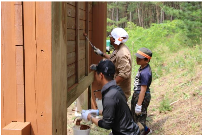
案内板塗装。凹凸もあって大変難しい作業でした。 小学生の児童も手伝って塗ってくれました。