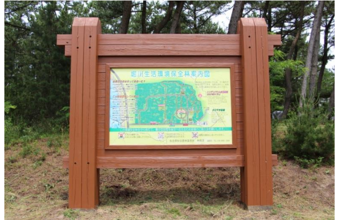
案内板塗装も終わり、以前より見やすくなった 気がします。