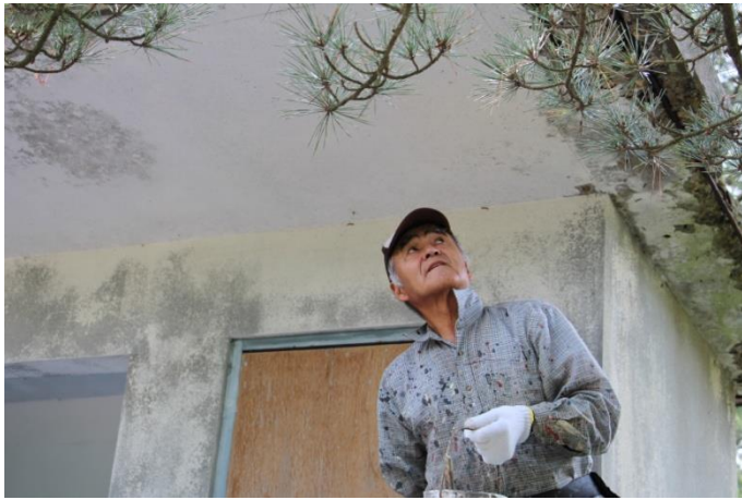
塗装職人のきびしい目。詳細部までチェックして塗装をしていました。