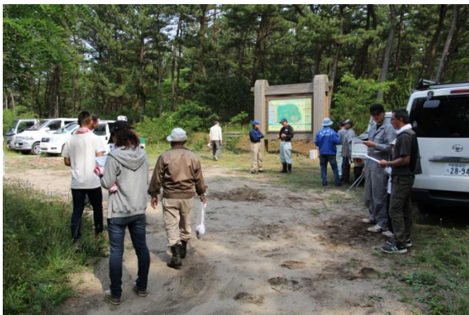
会場に集まる支部員のみなさん