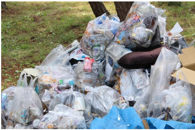
保全林内と周辺道路から拾い集めたゴミの山 ゴミの多さに驚かされました。