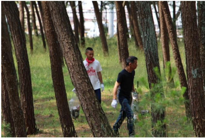
保全林内の中には、空き缶、空ペットボトル、ビニール袋が数多く散乱していました。