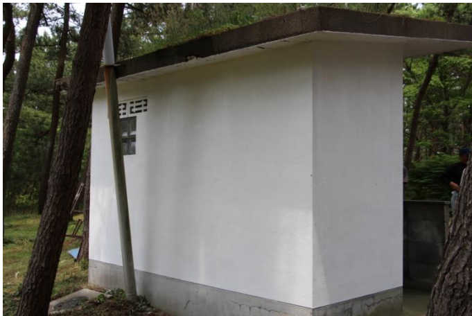
敷地内にあるトイレ塗装も終わりました。 きれいに仕上がり、気持ち良く用足しができそ うです。