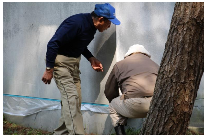
塗装前の養生。段取り八分です。