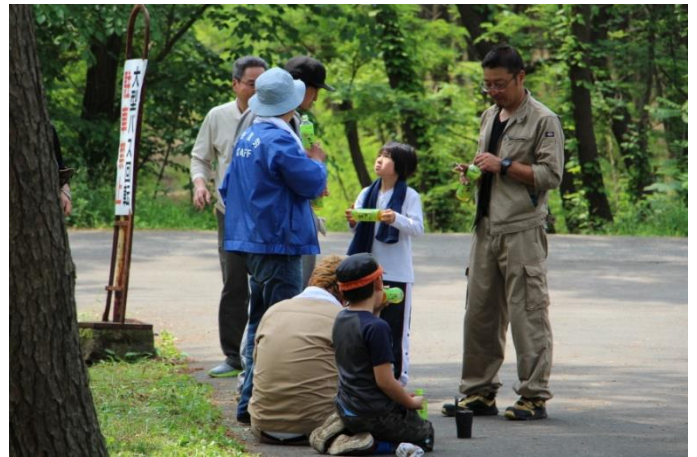
日が高くなるにつれて気温も上がりました。木陰で休憩して水分補給。熱中症対策も万全でした。