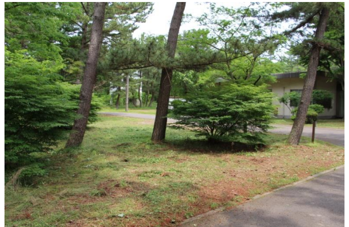
草刈りが終わり、きれいになった「秋田市老人いこいの家」敷地内。