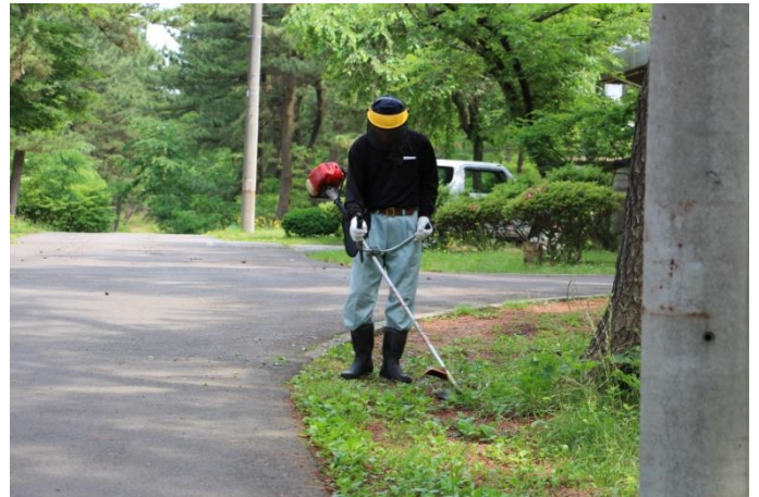
保護具もばっちり安全作業。