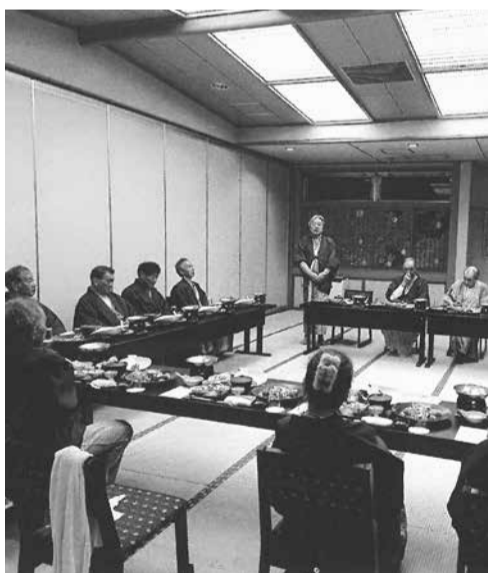
新役員と親睦を深める

船木副組合長からは「集団健診で結果を知ることが健康管理の第一歩」と受診の呼びかけがあり、また令和8年度の財政状況の見直しについて説明等がありました。