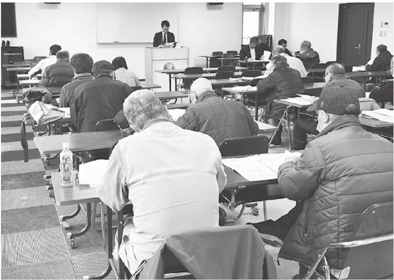
真剣な面持ちで講演を聞く参加者

度、確定申告のポイントとして、『年収の壁の見直し』による基礎控除・給与所得控除が見直されたこと、特定親族特別控除が創設されたこと、配偶者控除・扶養控除の要件が変更されたことなど税金対策特集号と学習会資料を使って細かく説明をしていただきました。