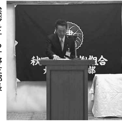
挨拶をする片野支部長

「本年度達成した健診受 診率70%の継続、青年 部の活性化、組織拡大 です。それに加え、次 回定期大会への参加者 増加が臨めるよう、そ れぞれ声掛けや皆さん への協力をお願いして いきます。役員改選も 行われましたが、昨年 と同じ顔ぶれとなりま した。 令和8年度も二ツ井 支部をよろしく願ひ します!!