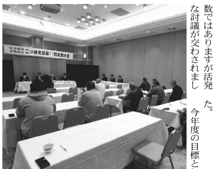
大雪の中16名の参加ありがとうございます