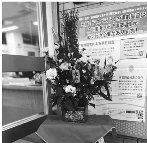
きれいに飾られた正月飾り

由利事務所にて「恒例の正月花飾り」を24名の参加で開催しました。と言っても花飾りの材料のお花と吸水スポンジ、お土産?をお渡しするだけです。 天気も悪く、寒いけど皆を楽しませようとサンタの帽子をかぶってお出迎え。クリスマスでもないのに「メリークリスマス!」と叫ぶ私達。