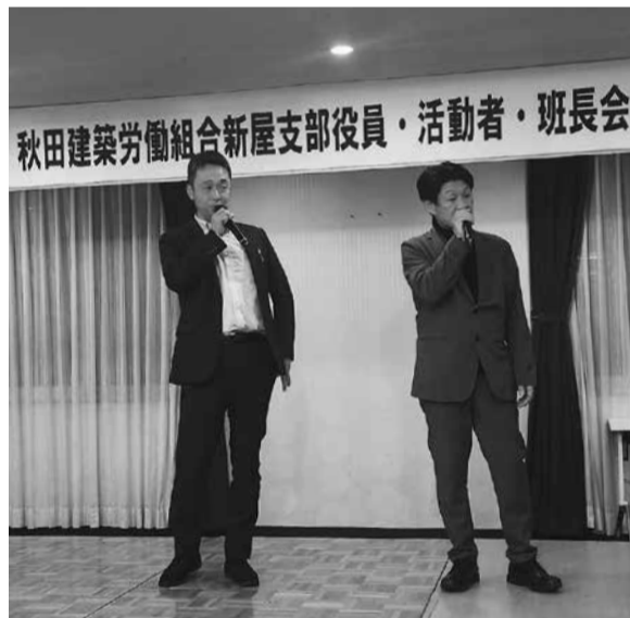
美声を披露するイケメンデュオ

ゴルフコンペやオルグ活動など支部内で精力的にイベントが実施されました。その都度、班長さん達の支えや副支部長達との連携が成功の助けになりました。そして会議内容に熱を加えるような懇親会に続きます。