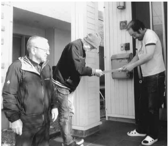
未加入者の紹介を呼びかけました