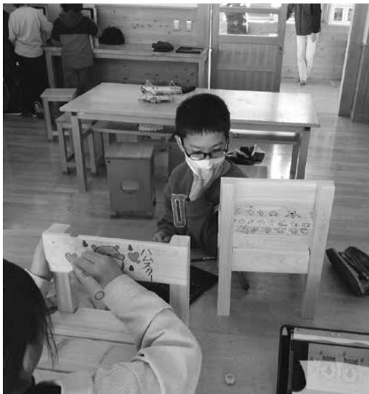
個性が光るお絵描きタイム

11月13日、能代市立ニッ井小学校の4年生を対象に木工教室を行いました。4回目となる今年もヒバ材で作るミニ椅子の製作をしました。