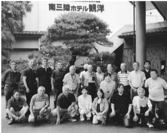
南三陸ホテル観洋

この後は幾つかの見学地を周り、ホテルに移動して、5年ぶりの支部員とその家族との交流の懇親会となりました。