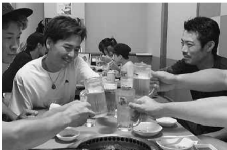
懇親会も盛り上げました