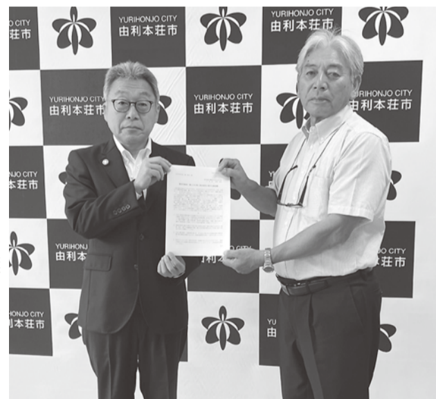
湊市長に要請書を手渡す(由利本荘市)

らからの要望を取り入れ更に良いものにしていきたい」とし、今後は意見交換もしていきたいと述べました。