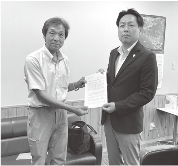
堀内町長に要請書を手渡す小沢支部長(八峰町)