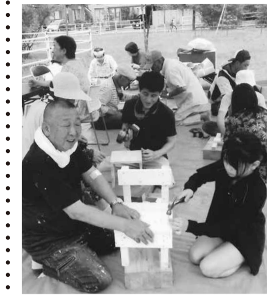
上手に釘打ち「トントントン」

この後は幾つかの見学地を周り、ホテルに移動して、5年ぶりの支部員とその家族との交流の懇親会となりました。