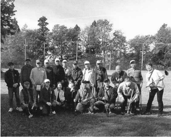
思い出の地で一枚

【角館支部 T・E】 私の地元、仙北市田沢湖梅沢にあります、大沼公園で、角館支部家族慰安会・グラウンドゴルフ大会が開かれました。 地元なのに中学生時代になべっこ遠足で訪れて以来、久しぶりに足を運ぶと、すごく綺麗に整備されたグラウンドゴルフ場・公園になっていてびっくりしました。暑くもなく、寒くもない。空は青空で時々吹く風が気持ちいい。開会式があり、記念撮影して、一緒にプレーするメンバーが発表されてゲームスタート。ヤバイ。皆さん上手なのに、マズい、何で俺だけボールの奥と手前を行ったり来たり。そんな日曜日の大沼公園は水辺があり、高台からの眺めも良く、プレーする方々は松やもみじの景色に少しリラックスした様子。 やがてゲームは終わり、懇親会へと。成績発表。そして表彰の後、乾杯。私の成績は118点で15位。少し悔しい。練習しよう。私のハートはメラメラと焼き芋が焼けるようなくらいリベンジに燃えています。