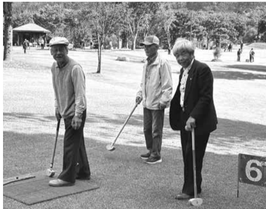
グラウンドゴルフを楽しむ様子

ゴルフなので少ない回数でホールに入れ、順位を決めるのですが、ホールには3本脚が有り、その脚が邪魔して上手く入らないのです。それがまた面白いところかな! 自身、初参加でグラウンドゴルフは支部大会以来3年ぶり、初心者同様でしたが、皆さん和気あいあい「ナイスショット」など声を掛け合いながら、その脚が邪魔して上手く入らないのです。それがまた面白いところかな! 自身、初参加でグラウンドゴルフは支部大会以来3年ぶり、初心者同様でしたが、皆さん和気あいあい「ナイスショット」など声を掛け合いながら、その脚が邪魔して上手く入らないのです。それがまた面白いところかな!