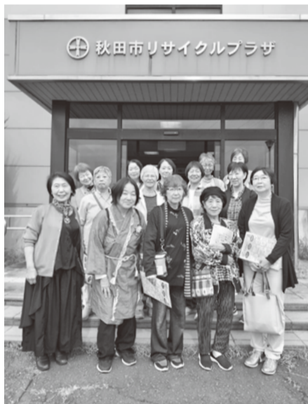
施設見学会に参加した皆さん

10月9日に女性部施設見学会が行われ、秋田市総合環境センター、秋田国際ダリア園の見学に参加しました。総合環境センターでは、ゴミ収集、分別、処理までのDVDを観た後センター内を見学、普段知ることができないゴミ処理の流れを説明して頂きました。秋田市では溶解炉を