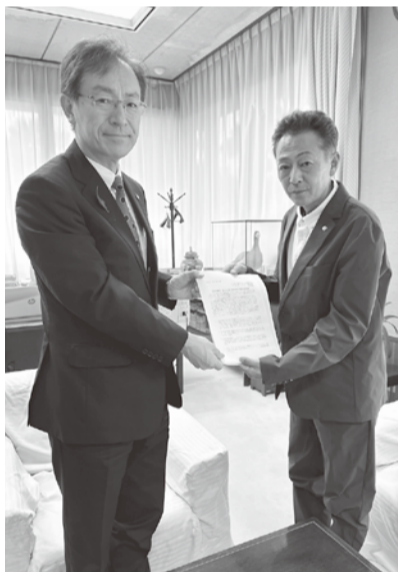
松田町長(左)と片野支部長(右)