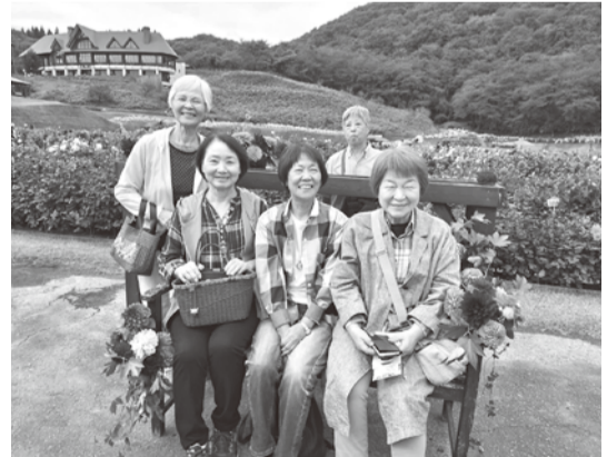
ダリアの前で笑顔

使ってゴミ処理をする為あまり細かい分別は必要ないこと、24時間365日稼働していること、溶融・資源化から排ガス処理・エネルギー回収まで施設内で安全に処理されていることなどを聞きました。ゴミの分別、出し方など参加者から次々と出される質問に、その都度丁寧に回答くださりとても参考になりました。ちなみに施設の