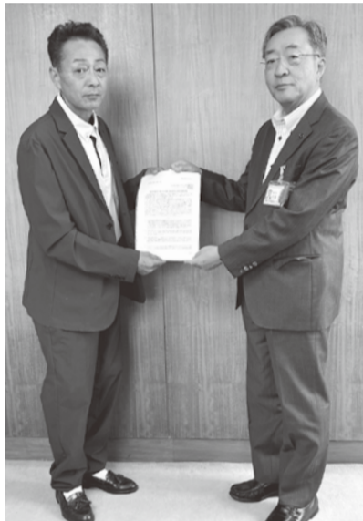
片野支部長(左)が要請書を手渡す

「公契約条例は先行事例も参考にしている。また制定には至っていない」「住宅リフォーム支援事業は16年目を迎え、要望のあったリセット制度も令和4年度から取り組んでいる。今後も継続したい」と回答がありました。