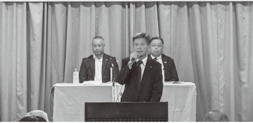
挨拶をする千葉組合同長

9月25日〜26日、全建総連北海道・東北地方協議会第65回定期大会が、秋田市「秋田温泉さとみ」で開催され各道県から116人が参加。秋田建労からは23人が参加しました。