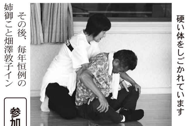
硬い体をしごかれています