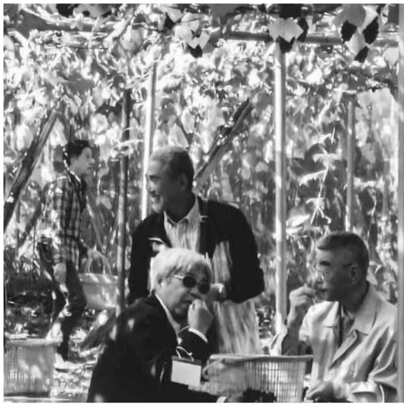
もぎたてはやっぱり美味です