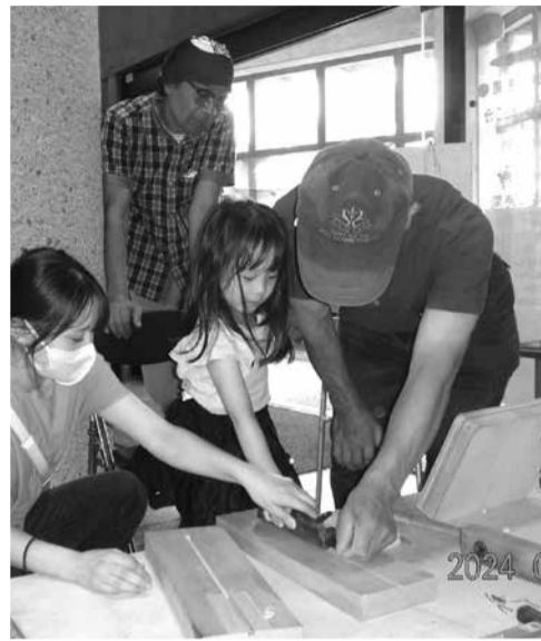
一生懸命がんばりました

慣れない金づちでくぎ打ちを頑張る、木工教室で完成させた本立てを、笑顔で持ち帰る親子の姿に暖かい気持ちになりました。