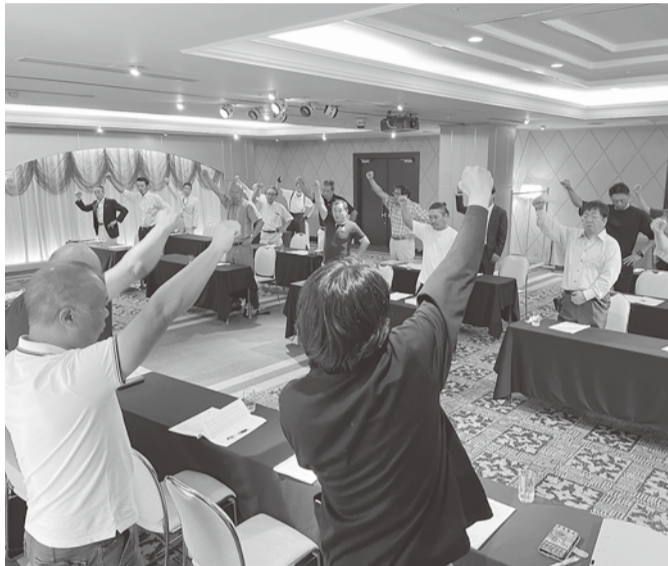
力強く組織拡大を誓う

中央ブロックは各支部で組合員訪問・現場訪問を行い、対面で組合員の近況や仕事の話を通して、未加入者の