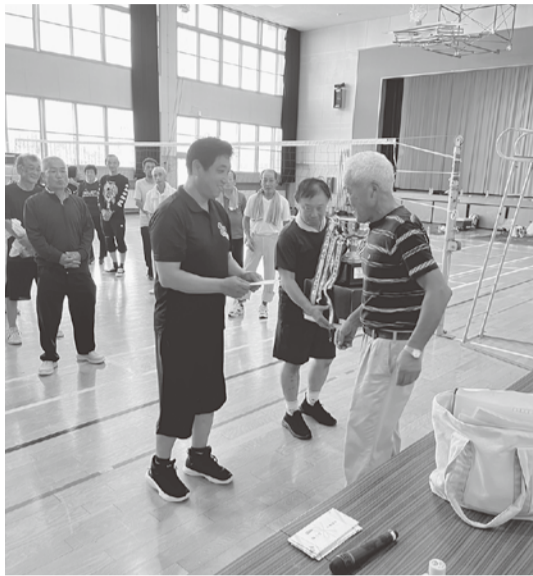
表彰を受ける大仙美郷支部

ながらも時折、秋の風が吹く、そんな感じの9月1日に県南ブロック各支部の方々が横手市大森町に集い、「県南ブロック健康体力づくりソフトバレー大会」を開催しました。