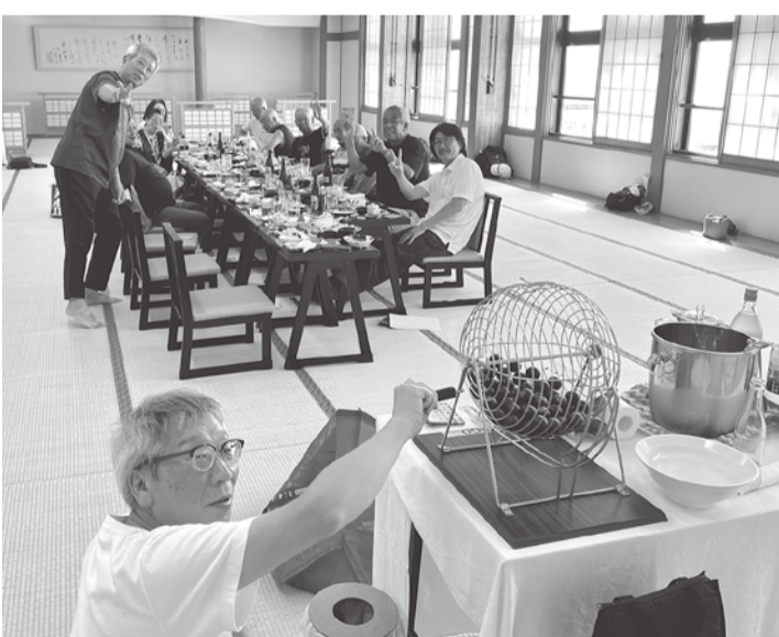
ビンゴで盛り上がっている様子

「いいバイクだ！カッコいい！」を連発していたので、青年も嫌な気持ちにはならず質問に答えていました。気温は高かったのですが、海の風は涼しく、大変心地良いものでした。その後、温泉に入り、懇親会が行われました。