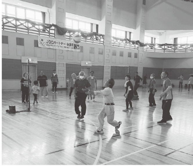
うまくレシーブできるかな

体力づくり教室は、8月25日に能代市のアリス・ニッ井・三種・ニッ井支部合同で40人程の参加でした。