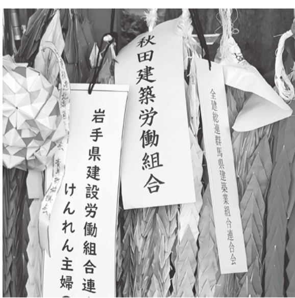
秋田建労の千羽鶴

山王四丁目 今年1月1日に起きた能登半島地震で住宅が倒壊、または半壊などで住むことができなかった被災者のために、応急仮設木造住宅が9団地623戸と過去最大規模の建設が現在も進められています。また、7月25日から東北地方を中心に続いた大雨災害は、山形県の庄内・最上地方に深刻な被害をもたらしました。その復旧に向け、応急仮設木造住宅の建設が9月5日から大工工事が始まりました。(2団地36戸【戸沢村28戸、鮭川村8戸】)。能登半島地震の工事は被害が大きかったため、全国の仲間が集結し(秋田建労からも数名が参加しました)、工事を行ってまいります。山形では、山形県連の仲間、総勢38名で作業が始まっています。1日も早い復興、復旧を願っています。災害が起きる度に私たち建設職人の必要性、重要性が顕著に表れます。職人が不足している今、職人の労働環境を良くし、職人の数を増やす運動をより強く推し進めなければなりません。